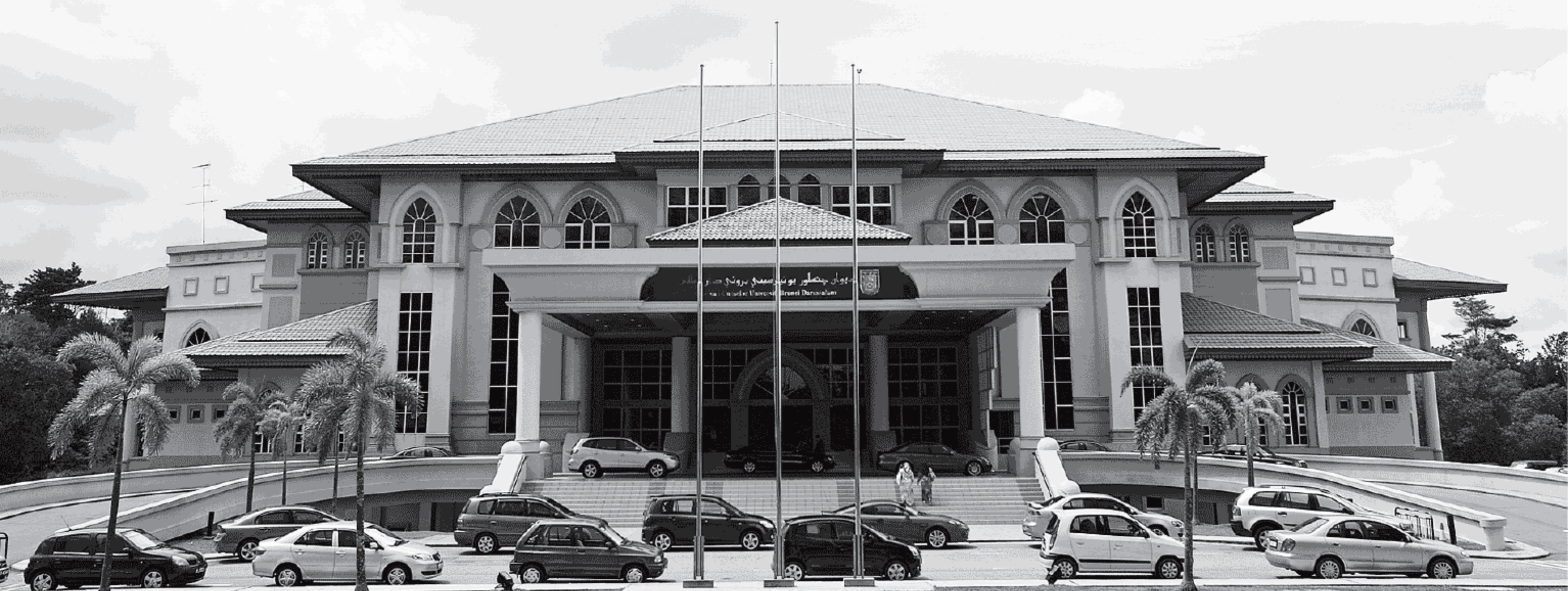
Chancellor Hall at UBD.

Yuran Tawaran : $25.00 (tidak dikembalikan).